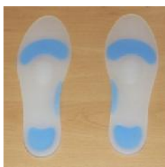
شکل ۲: کفی سیلیکونی مورد استفاده

اطلاعات مربوط به فشار کف پای با استفاده از سیستم اندازه گیری فشار کف پای Pedar (ساخت شرکت آلمانی Novel) در آزمایشگاه بیومکانیک گروه ارتز و پروتز دانشگاه علوم بهزیستی و توانبخشی و با فرکانس ۵۰ هرتز گرفته شد. بخش سخت افزاری این دستگاه دارای پنج ساینز کفی است که هر کدام از این کفی ها دارای ۹۹ حسگر خازنی با وضوح ۲/۲-۱/۶ سانتی مترمربع و ضخامت ۲/۵ میلی متر است که در داخل کفش بین کف پا و کفش قرار می گیرد و توسط سیم به جعبه انتقال دهنده داده ها متصل می شود. این جعبه که داده ها را توسط بلوتوث به کامپیوتر انتقال می دهد؛ به کمر فرد آزمون دهنده متصل می شود (شکل یک).